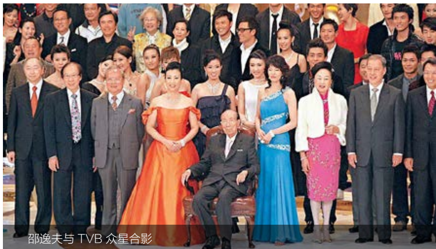
邵逸夫与 TVB 众星合影

之所以会如此，一方面与香港作为法制健全社会对法律变化稳定性的要求有关；另一方面更与香港于 1997 年回归中国，随后又突然被卷入亚洲金融