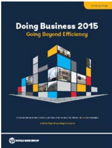
《2015 年全球營商環境報告》

2014 年 10 月 29 日，在世界銀行發布的《2015 年全球營商環境報告》中，新加坡連續 8 年名列第一。排名前 10 的依次為：新加坡、新西蘭、香港、丹麥、韓國、挪威、美國、英國、芬蘭和澳大利亞。