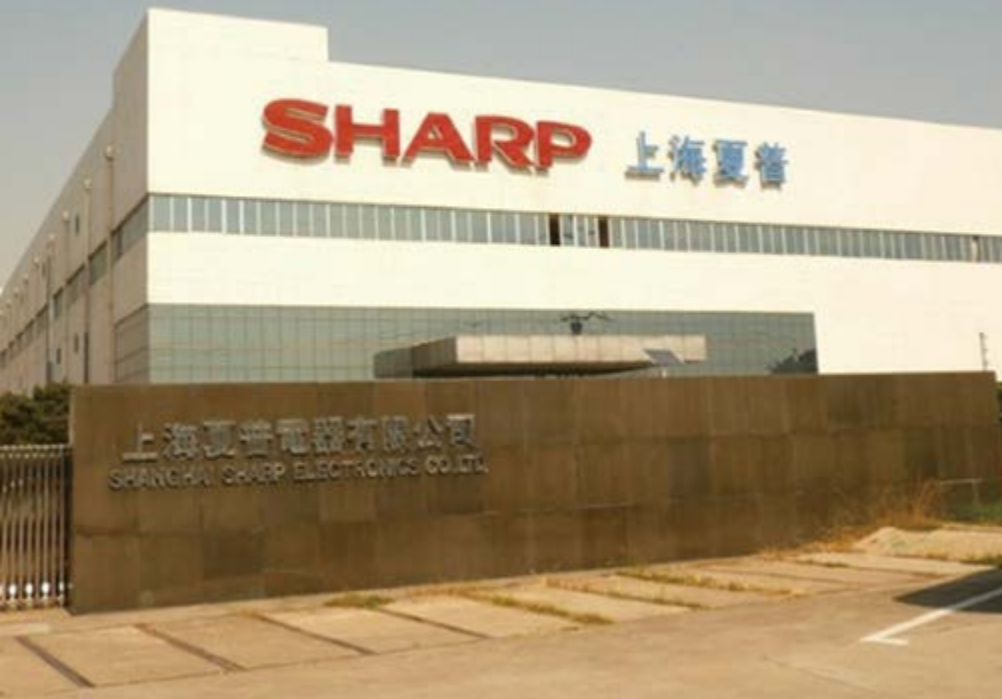
上海夏普电器有限公司