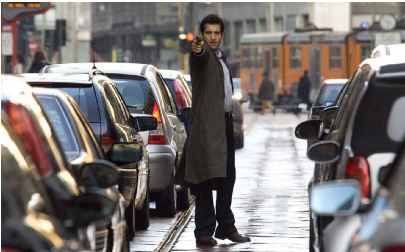
<The International> 剧照

这是英国司法史上前所未有的桩案件。同样创下记录的则是英国法律史上最长的法庭陈词——英格兰银行首席辩护律师尼古拉斯·斯塔德伦长达 119 天的首轮陈词。■